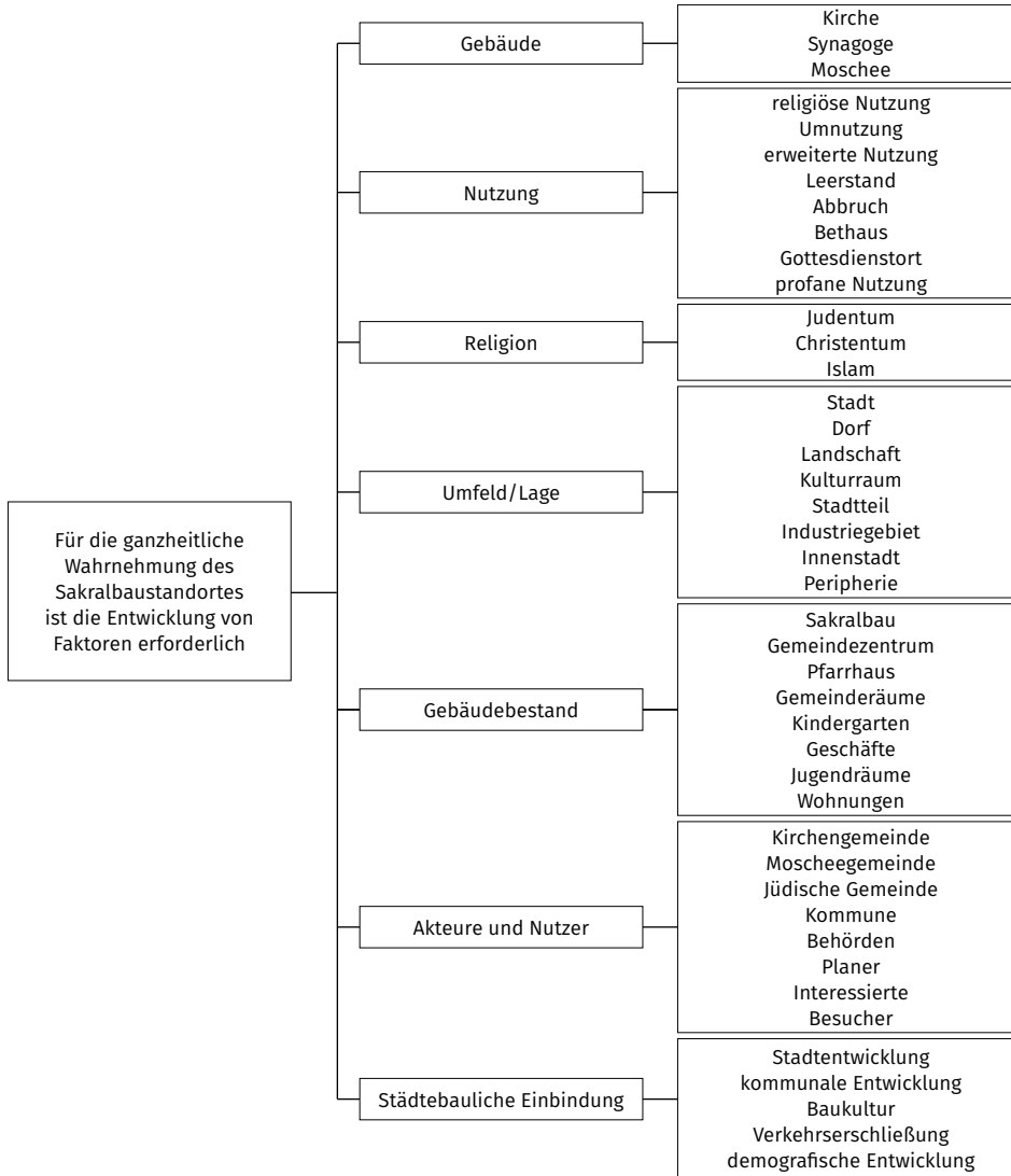
Abbildung 1-2 Forschungsleitsatz und Einflussmerkmale. 27