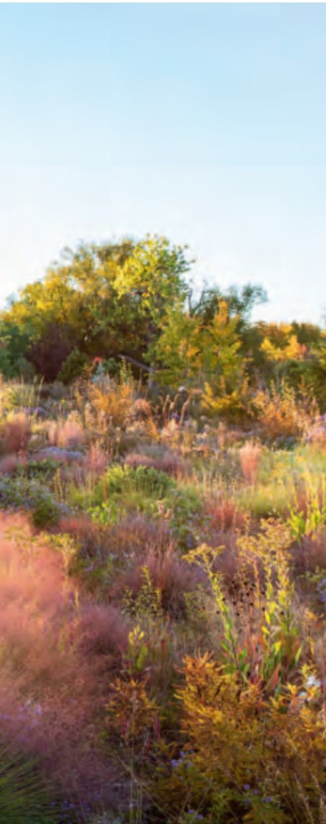
Pflanzungen in Spring Creek

Wir leben in einer Zeit, die ein bewussteres Design und bewusstere Entscheidungen erfordern. Dreamscapes für die Zukunft ist der Beweis dafür, dass es auch zukünftig schöne Gärten und Parks geben wird, an denen wir uns erfreuen können.