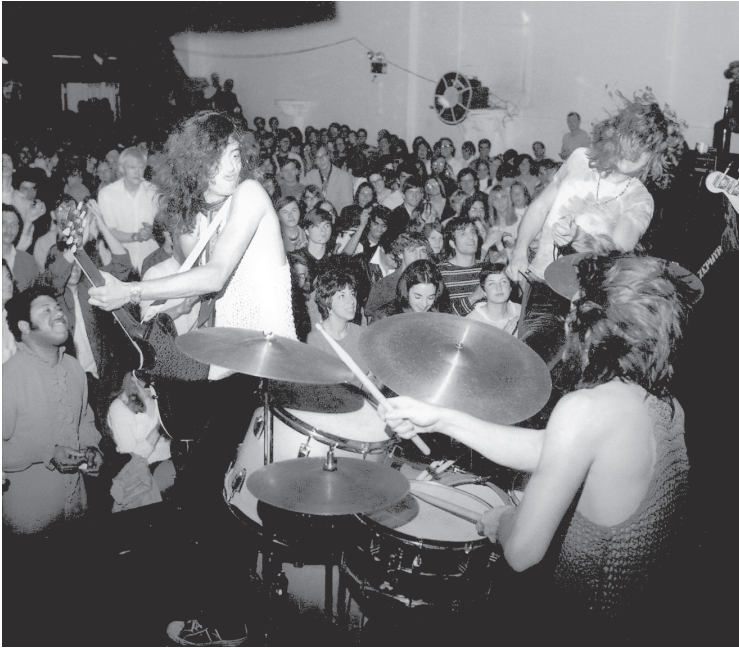
Die Boston Tea Party im Januar 1969 – wo alles sich für immer änderte

Them. Aber Led Zeppelin hatten Page in eine andere Dimension geführt, in einen Landstrich des Rock 'n' Roll, der schwer zu beschreiben war. Manchmal war es geerdet und bluesig, manchmal frei improvisiert, manchmal eine Mischform, die sie Heavy Metal nannten, und all das gewürzt mit genug Folk, Funk und Rockabilly-Elementen, um sämtliche Grenzen zu verwischen. Da gab es eine Menge zu verarbeiten für einen angehenden Rock 'n' Roller. Page und seine Band live zu erleben würde helfen, die Dinge klarer zu sehen.