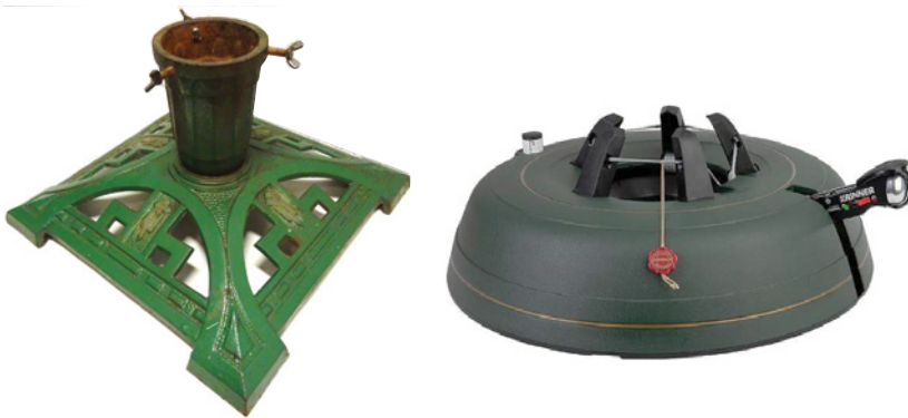
Bild 1.1 Zwei Konzepte für Christbaumständer – welches davon ist das erfolgreichere?

Dass ein langjährig etabliertes Produkt deutlich besser gestaltet werden kann, zeigen wir Ihnen am Beispiel eines Christbaumständers . Bislang wurden die Bäume über ein Schraubprinzip von mehreren Seiten in einem Ständer fixiert (Bild 1.1 links). Nachteilig daran war allerdings, dass man alle drei Schrauben eindrehen und zugleich den Baum in senkrechter Position halten musste. Ein Christbaumständer mit der sogenannten Rundum-Einseil-Technik ist deutlich leichter zu bedienen, da lediglich mit einem Fußpedal alle fünf Fixierungen gleichzeitig mit gleichem Druck an den Baumstamm angelegt werden, während man beide Hände frei hat, um den Baum in seiner Position zu halten (Bild 1.1 rechts). Heute sind über 90 % aller im Markt angebotenen Christbaumständer mit dieser Seiltechnik ausgestattet.