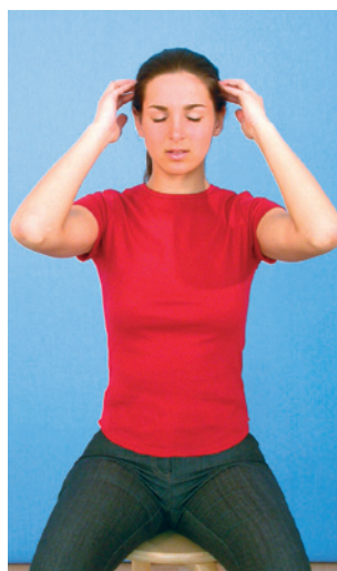
Scheitelbeine mit flächigen Fingerspitzen aktiv entspannen