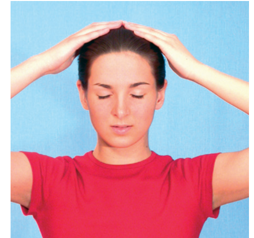
Sitzend: Scheitelbeine berühren, dem Craniosacral-Rhythmus lauschen