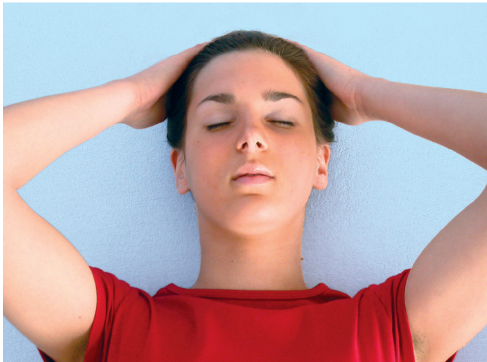
Legend: Scheitelbeine berühren, dem Craniosacral-Rhythmus lauschen

Weitere Ausführung wie vorangegangen unter Punkt 1 bis 5 (siehe Seite 150).