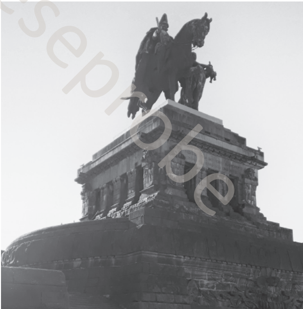
Kaiser Wilhelm I. hoch zu Ross hat Rhein und Mosel stets im Blick.

Für den Sockel gab es in den Folgejahren mehrere Nutzungsvorschläge, alle unter der Voraussetzung, dass Kaiser Wilhelm I. nicht mehr auf ihm thronen sollte. Die Errichtung eines Kreuzes