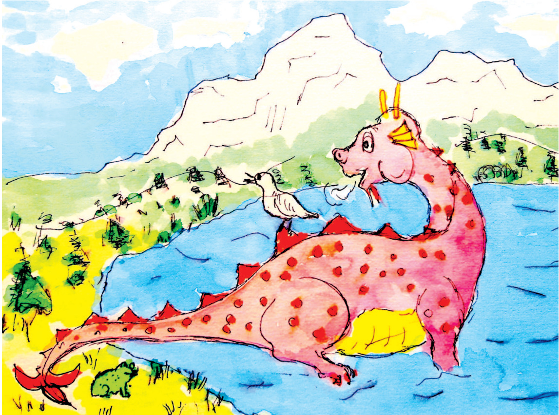
Nico lebt vergnügt im grossen, blauen Genfersee