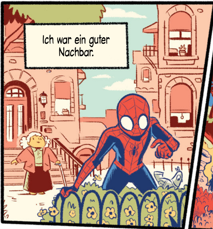
Ich war ein guter Nachbar.