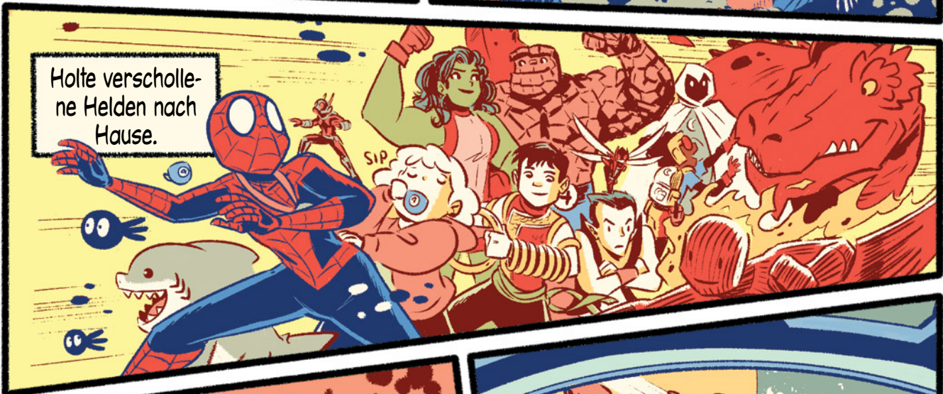
Holte verschollene Helden nach Hause.