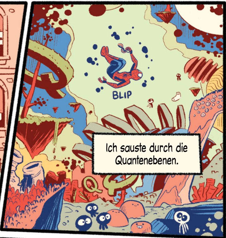
Ich sauste durch die Quantenebenen.