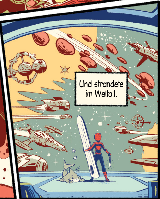
Und strandete im Weltall.