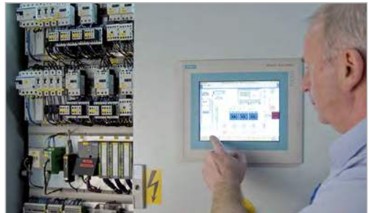
Bild 2: Umwelttechniker an einer Anlage zum Wasserrecyclen in einem Hallenbad