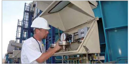
Bild 1: Prüfung einer Entsalzungsanlage von Meerwasser

Die umwelttechnischen Fachkräfte im engeren Sinne können in allen Bereichen der Wirtschaft und des öffentlichen Dienstes tätig sein.