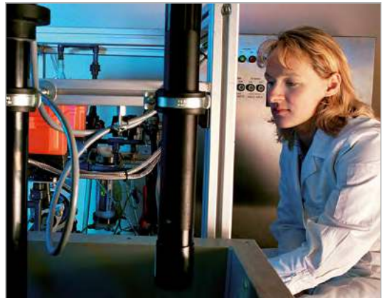
Bild 2: Umwelttechnische Assistentin bei der Wasseruntersuchung