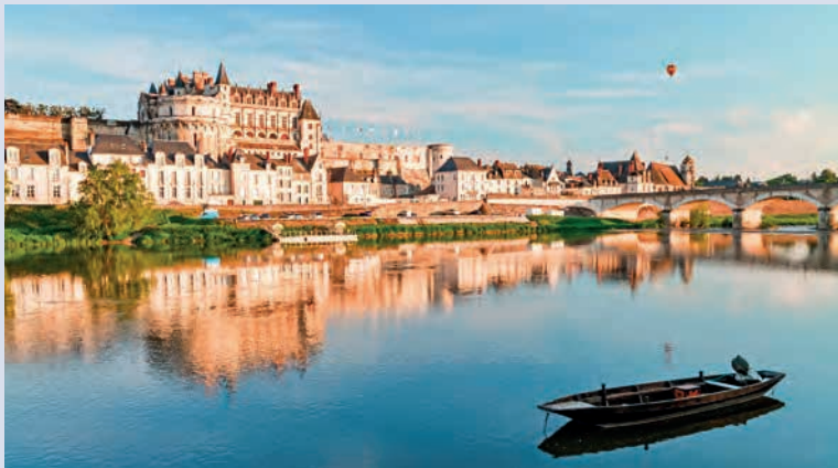
Blick über die Loire auf Amboise und sein Schloss