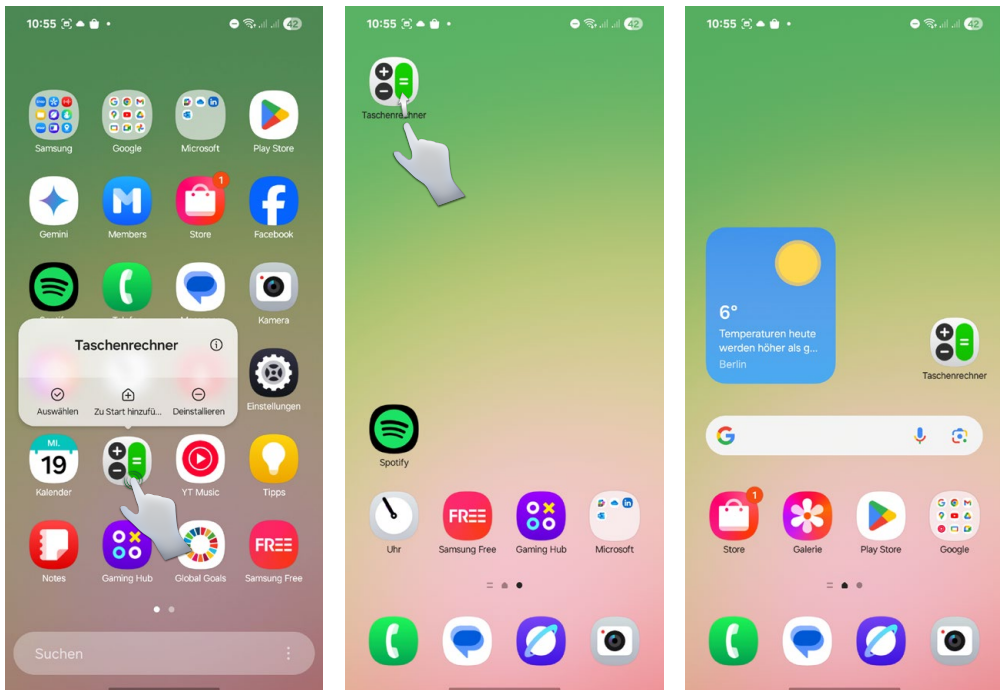
App aus der App-Liste auf dem Startbildschirm ablegen und verschieben

Am linken Bildschirmrand der zweiten Startbildschirmseite erscheint beim Verschieben eines App-Symbols der angedeutete Rand der ersten Startbildschirmseite. Schieben Sie ein App-Symbol über den Rand hinaus, wird die App auf die erste Seite verschoben. Genauso können Sie eine App nach rechts über den Rand schieben. Dann wird eine neue Startbildschirmseite angelegt, auf der Sie diese App platzieren können. Es ist auch möglich, eine App direkt aus der App-Liste an die gewünschte Position auf dem Startbildschirm zu ziehen.