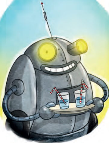
Albert Tante Agnethas Haushaltsroboter