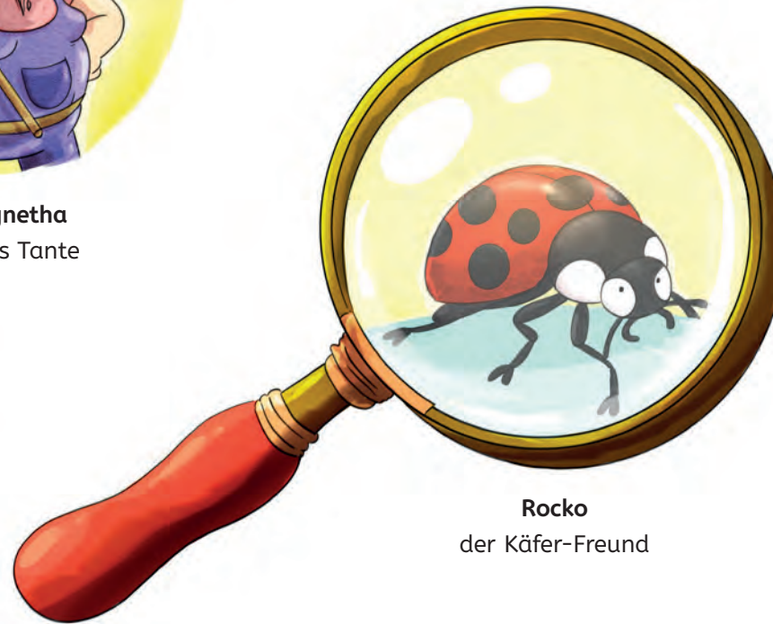
Rocko der Käfer-Freund