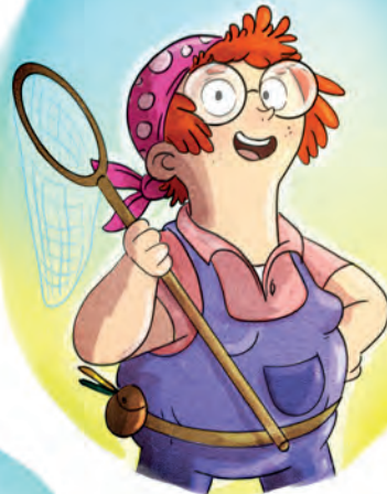
Agnetha Leos Tante