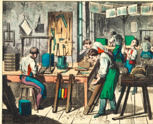
Le relieur. Der Buchbinder. The bookbinder.

Erstmals festgeschrieben wurde das duale Prinzip der Berufsausbildung – praktische Ausbildung im Betrieb und theoretischer Unterricht in der Berufsschule 4 – durch die Gewerbeverordnungs-Novelle von 1897. Eine Lehrlingsausbildung in den Industriebetrieben gibt es jedoch erst seit Mitte der 1920er-Jahre.