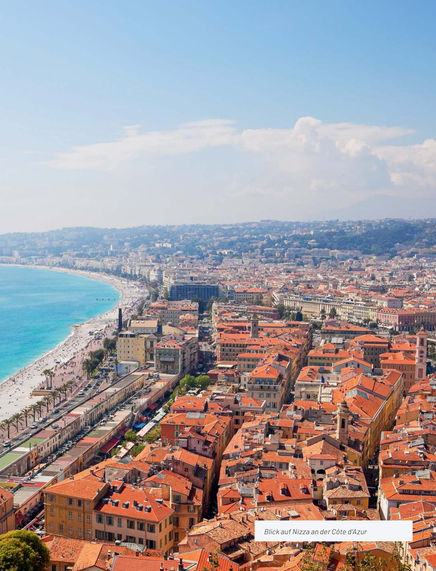
Blick auf Nizza an der Côte d'Azur