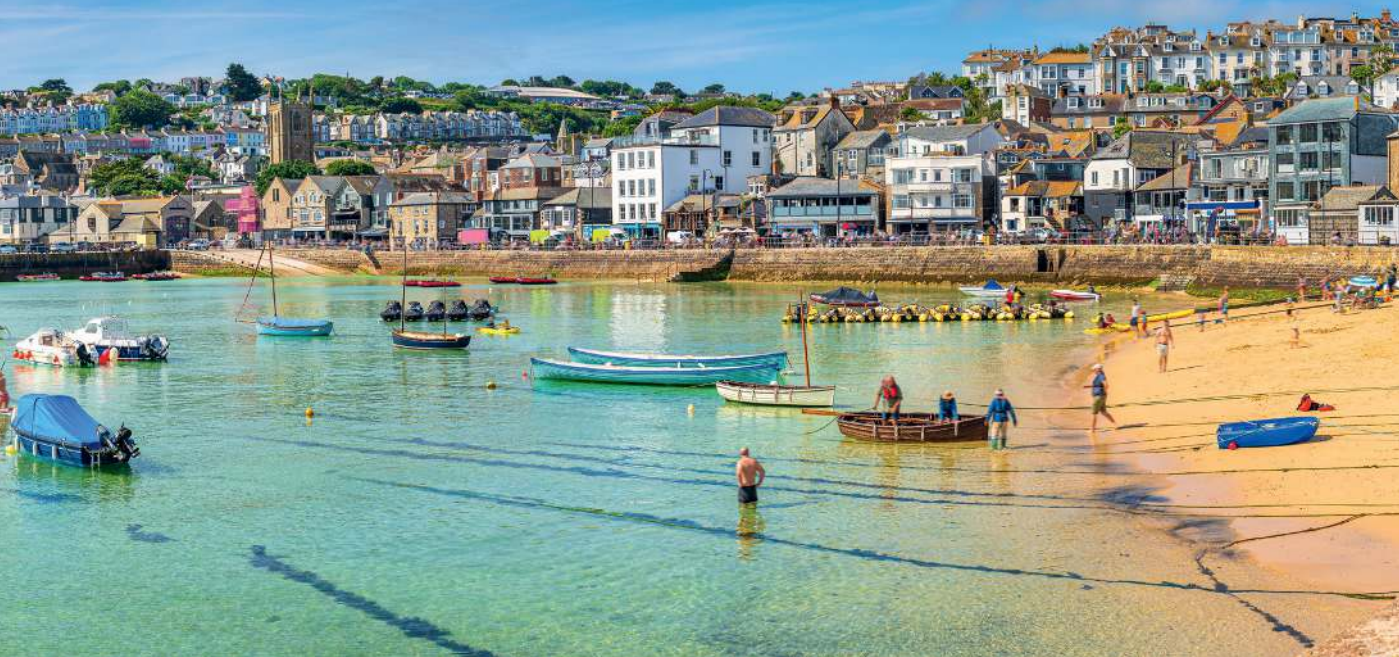
Der kleine Künstlerort St Ives im englischen Cornwall und sein Hafen sind rundum von Meer und Stränden umgeben.