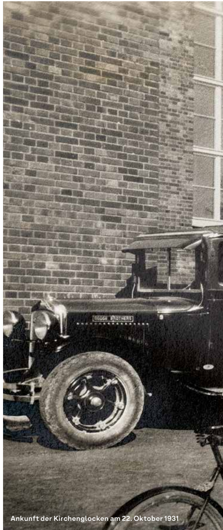
Ankunft der Kirchenglocken am 22. Oktober 1931

Das Gemeindehaus ist ein Identitätssort für viele Menschen im Quartier, die hier getauft, konfirmiert und verehelicht wurden. Mit seinen multifunktionalen Räumen, die bereits von Anfang an auch für private Veranstaltungen vermietet wurden, war das Gemeindehaus für die Menschen nicht nur als Ort der Religion relevant, sondern bot mit den Jugendräumen Möglichkeiten für Freiraum an und war Heimat für viele Vereine.