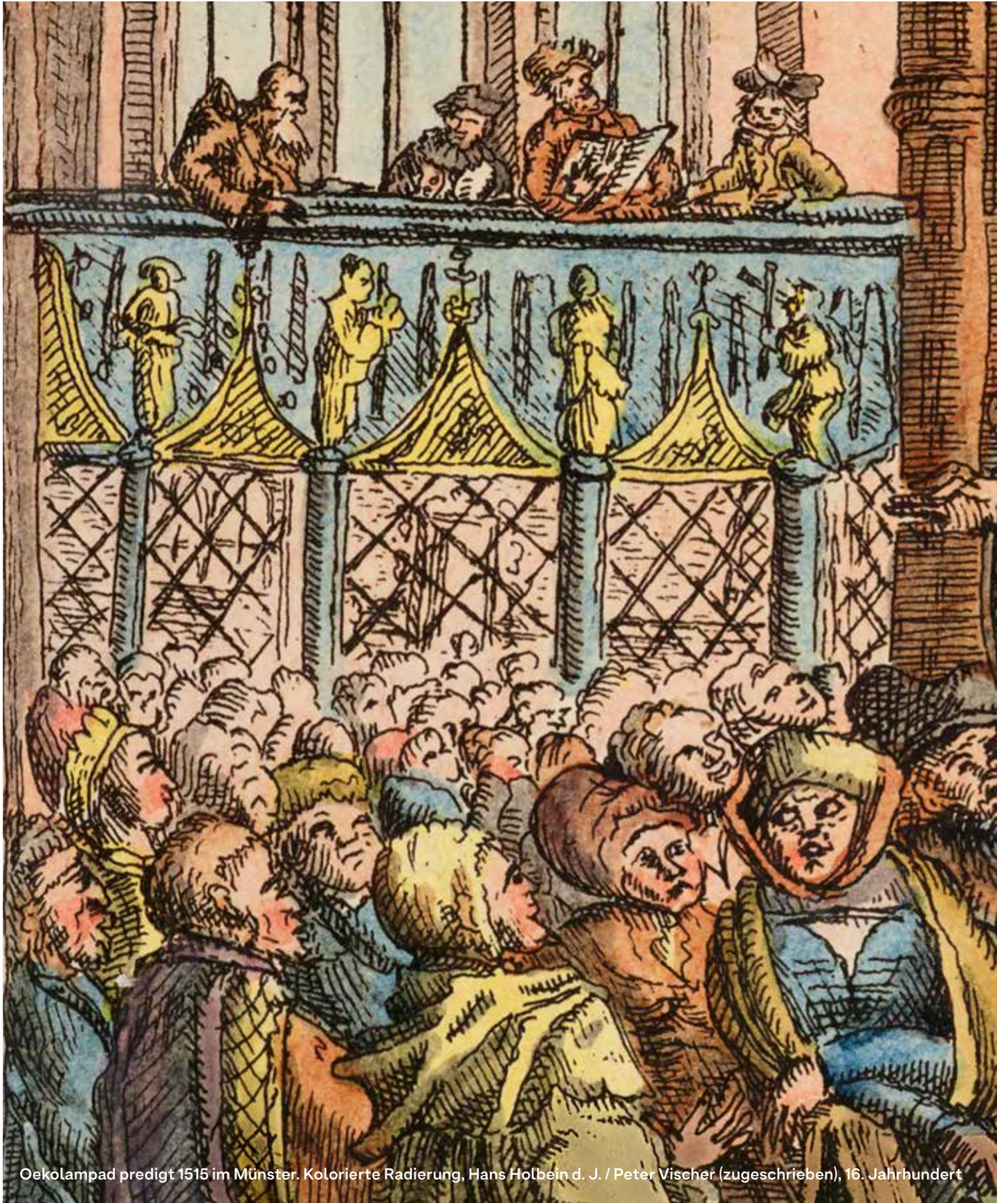
Oekolampad predigt 1515 im Münster. Kolorierte Radierung, Hans Holbein d. J. / Peter Vischer (zugeschrieben), 16. Jahrhundert