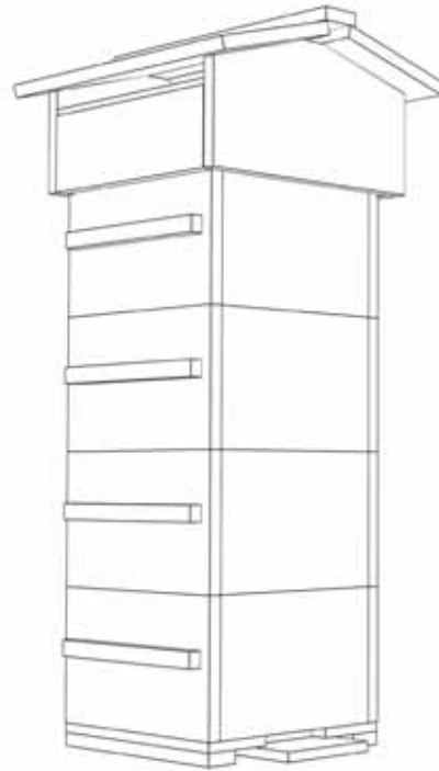
2.3 Die Volksbeute

gesamten Montage ein Winkel-Werkzeug. Im Zweifelsfall Nägel zunächst nur teilweise einschlagen. Um eventuelle Krümmungen der Bretter auszugleichen, orientieren Sie sich an den auf dem Hirnholz sichtbaren Jahresringen und legen Sie die Seite des Brettes, die näher an der Außenseite des Baumes lag, an die Innenseite der zu nagelnden Verbindung.