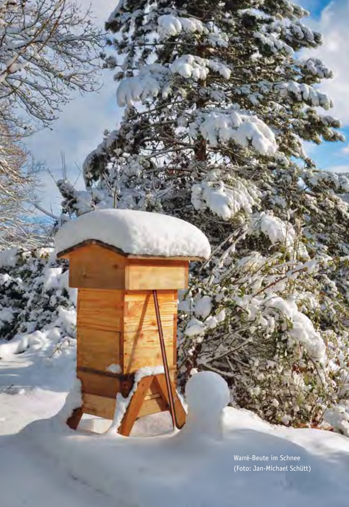
Warré-Beute im Schnee