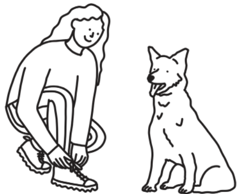
Zeit für eine kleine Spielpause!

Manche Hunde spielen so gern mit ihrem Menschen, dass sie vor Begeisterung ziemlich grob werden. Wenn dein Vierbeiner beim Spielen anfängt zu beißen, dich aber in den Pausen in Ruhe lässt, gib ihm ein Spielzeug in die Schnauze – nicht zum Spielen, sondern damit er seine überschüssige Energie an dem Gegenstand auslassen kann und dir nicht wehtut.